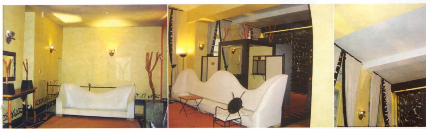
De l'entrée vers le jardin, les murs colorés d'ocre jaune créent une ambiance doucement lumineuse, en harmonie avec le bleu très clair du ciel nuagé finement exécuté au plafond.